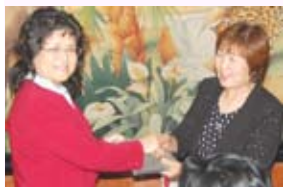
・粋なスマイルありがとう。 太丁腹賞 横手会員