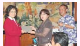
・いつもお花をありが賞 柏木会員