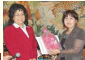
・柏木会員 毎例会でのお花に対して