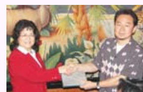
・いつもタイムリーな話題だったで賞 三部会員