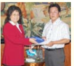
・竹中会員 ホームページの立ち上げ、クラブ会報委員長に対して